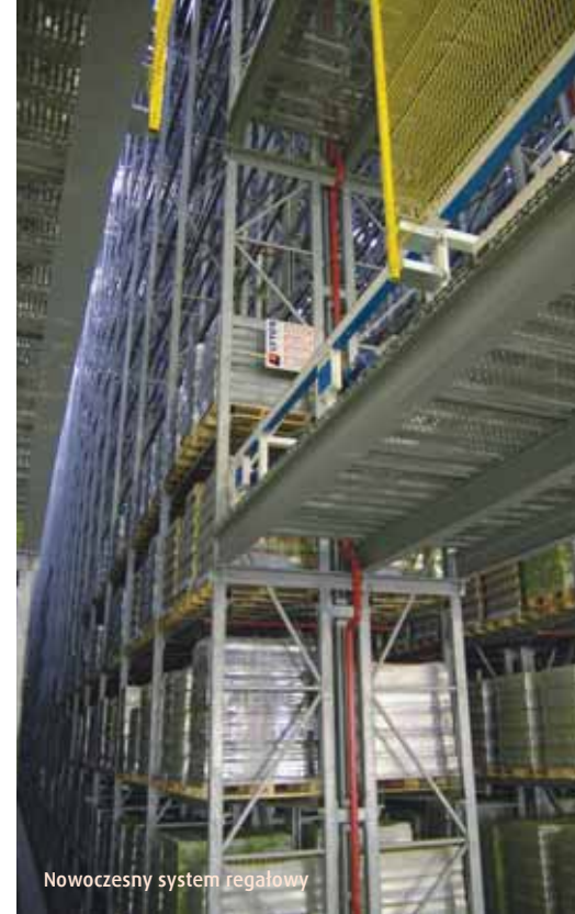
Nowoczesny system regalowy