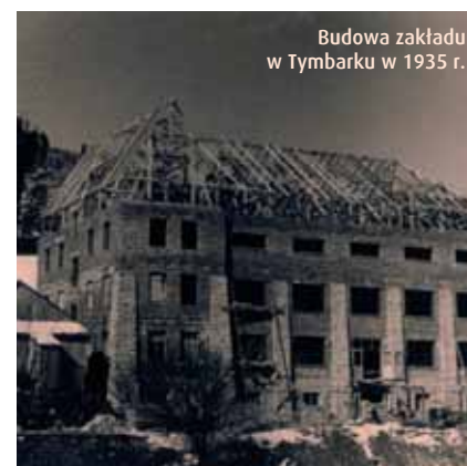
Budowa zakładu w Tymbarku w 1935 r.

Ze względu na ubogą glebę i ostry klimat tutejsi rolnicy od stuleci zajmowali się sadownictwem, którego początków należy szukać już w XVII w., kiedy to Dunajcem i Wisłą wysyłano pierwsze sliwki do Gdańska. W wieku XIX propagowano w okolicach Tymbarku sadzenie sadów wzorem Tyrolu i innych podalpejskich krain, należących podobnie jak Galicja do Austrii. Władze Galicji wprowadziły nawet obowiązek sadzenia drzew