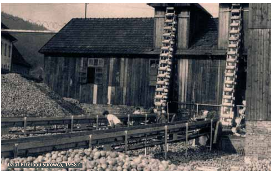
Dział Przerobu Surowca, 1958 r.