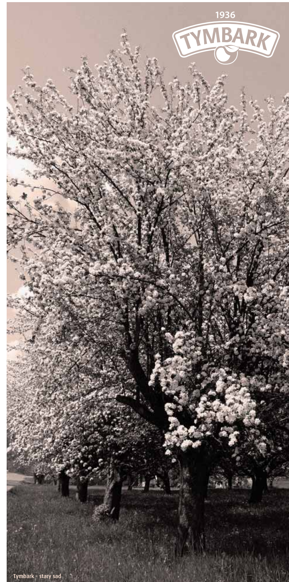
Tymbark - stary sad