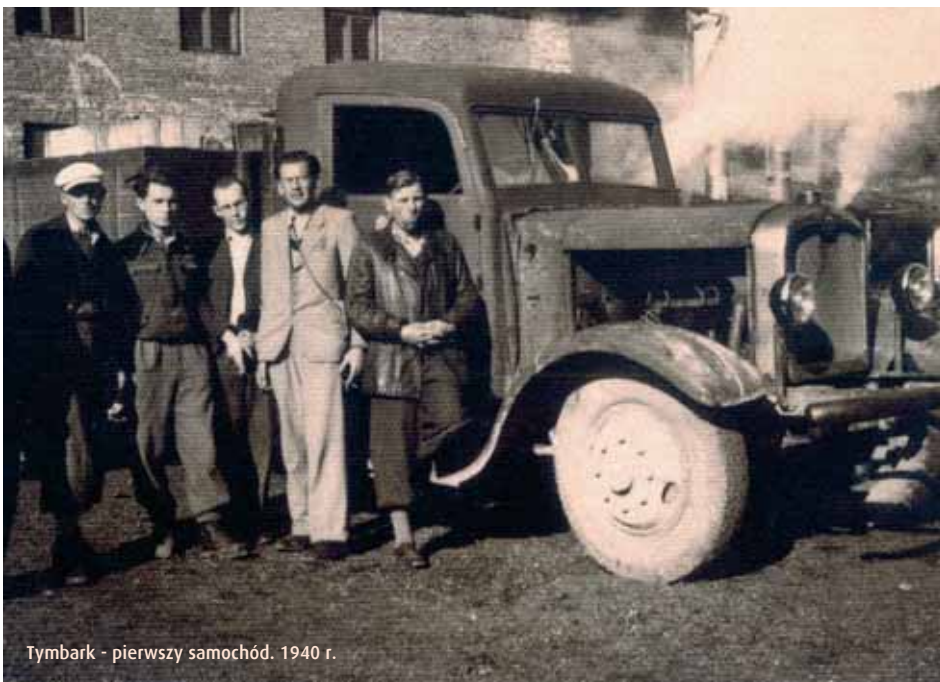
Tymbark - pierwszy samochód. 1940 r.